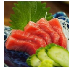
「いなせり体験セット」内、 中トロイメージ

今回のサービス開始に合わせ、『いなせり市場』の一押し商品である天然本マグロの赤身（約120g）と中トロ（約120g）をお楽しみいただける「いなせり体験セット」をご用意しました。ぜひ『いなせり市場』をお試しいただき、「いなせりスーパーポイント」サービスをご利用ください。