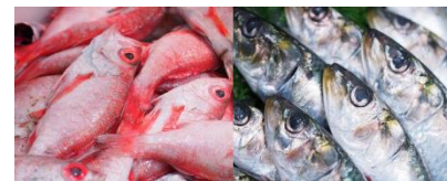
※『いなせり市場』取扱商品イメージ

豊洲市場の“仲卸による目利き力”を活かした高品質な魚介商品をご家庭でも味わっていただくことを目的に、2018年11月に開設したECマーケット。2019年12月からは青果の取り扱いも始めました。