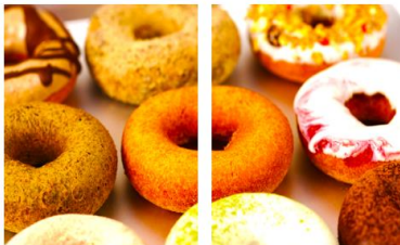
フロレスタドーナツ特集 自然素材の安心ドーナツ

全国38店舗で愛される、とってもおいしい天然素材ドーナツです。いよいよ公式ネットショップでも便利に購入いただけるようになりました。防腐剤・保存料の添加物は一切使わない、安全で本当においしいドーナツです。