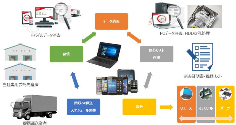
回収～消去～処分までの運用例

当社は今後さらに中古端末の買取サービスを拡大させるとともに、派生するビジネス展開を視野に入れ、サービスの幅を広げて参ります。