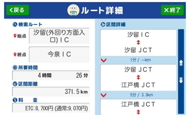
<時間・距離・料金別のルート検索>