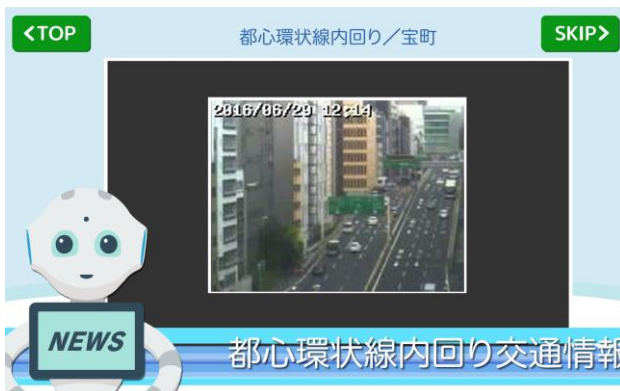
<ライブ交通映像で、混雑状況を確認>