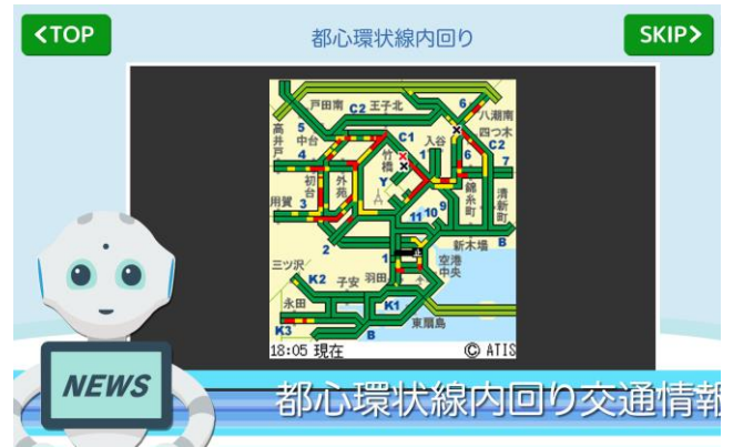
<交通情報を表示し、「Pepper」が音声で案内>