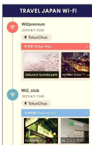
< TRAVEL JAPAN Wi-Fi 「レコメンド配信」 >

当社は、東京オリンピックも視野に、対象ユーザを訪日外国人観光客へも拡大し、人々の「おでかけ」をもっと便利にもっと楽しくする情報サービスを提供してまいります。