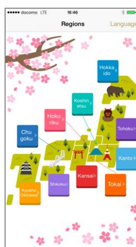
< 『につぼん桜絶景』アプリ >