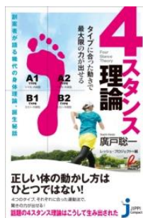
『4スタンス理論』 著: 廣戸聡一