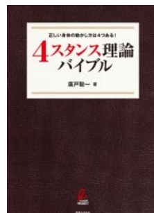
『4スタンス理論バイブル』 著: 廣戸聡一