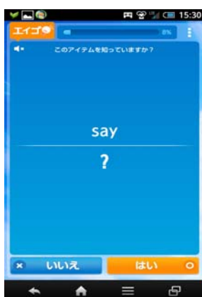
①問題の単語が発音とともに表示