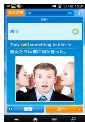
③答えと例文が発音とともに表示