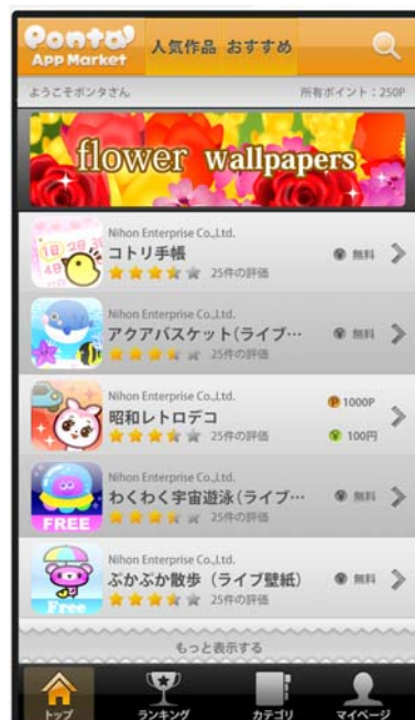
※画面はイメージです。