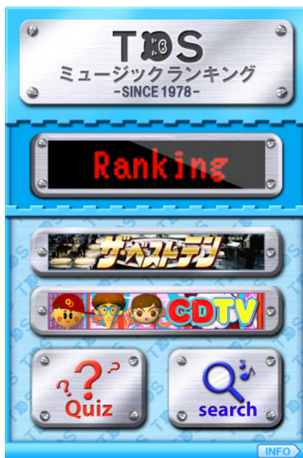
「スタンダードモードTOP」