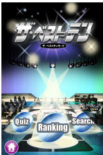
「ザ・ベストテンモードTOP」

当社は、今回の取り組みをきっかけに、さらに各企業の特徴を活かした携帯やスマートフォン向けの企画・構築・運営等、企業向けソリューション事業を拡大し、「お客様満足度No.1」を目指してまいります。