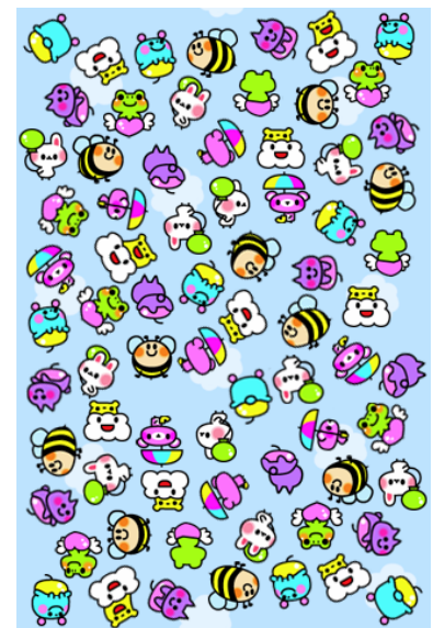
タップするたびにキャラクターが増えます