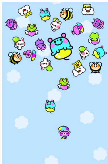
稀に、大きなキャラクターが登場します