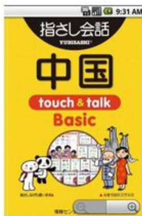
Androidアプリ「指さし会話 中国 touch&talk Basic」