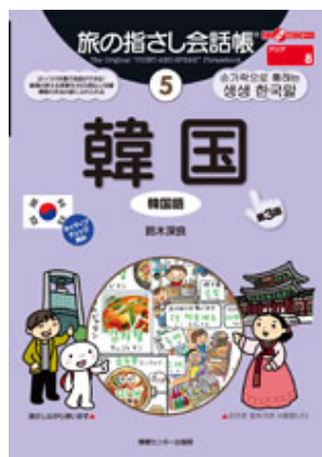
書籍「旅の指さし会話帳5韓国(韓国語)」

また、書籍以外にも、Android端末、iPad/iPhone/iPod touch向けアプリケーションや任天堂DSソフト、CASIO、SHARPの電子辞書、携帯電話へのコンテンツ提供の他、同社製品ではパソコンや iPod 対応語学ソフト等、他メディア展開も行っております。