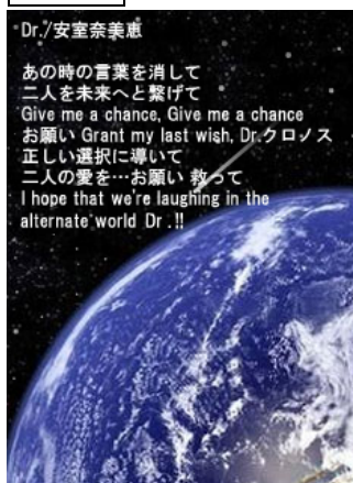
Dr. / 安室奈美恵