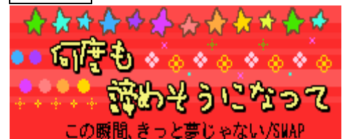
この瞬間、きっと夢じゃない/SMAP