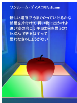
ワンルーム・ディスコ/Perfume