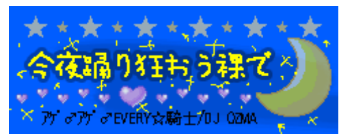
アゲみアゲみEVERY☆騎士/DJ OZMA