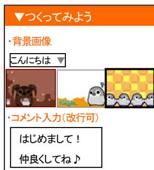
【背景画像 (イメージ)】