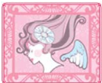
タロット占いパック

カードを開くと、あなたの真実が見えてしまう！？本格的なタロット占いが楽しめる「占いきせかえ」。