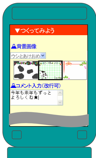
【背景画像 (イメージ)】

3 種類の画像から背景を決定します。 (ここでは中央の画像を選択) メッセージを入力します。