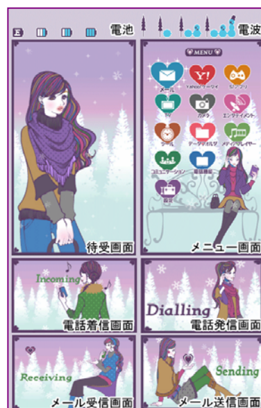
コンテンツイメージ: Winter

2008 年よりフリーのイラストレーターとしてモバイル、Web、書籍等で活動。デザインフェスタ等のアートイベントや、ギャラリー、カフェでの展示にも参加。