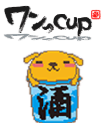
コンテンツイメージ:うたがめ「温泉」

居酒屋に住むワンっCUP。気がつく、悩めるサラリーマンややさぐれているOLたちの話し相手となり、皆を癒している。