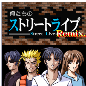
< ゲームイメージ 1 >