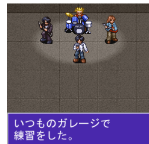
< ゲームイメージ 3 >